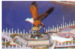
イーグルスクエア